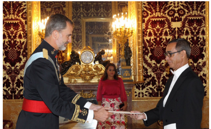
Entrega de cartas credenciales ante S.M el Rey D. Felipe VI del embajador de Cabo Verde en España, Excmo. Sr. Manuel Ney Monteiro Cardoso. 20 de septiembre 2017

Posee dominio nativo del portugués y del crioulo, excelente francés, buen nivel de inglés y conocimientos aceptables de español, alemán e italiano.